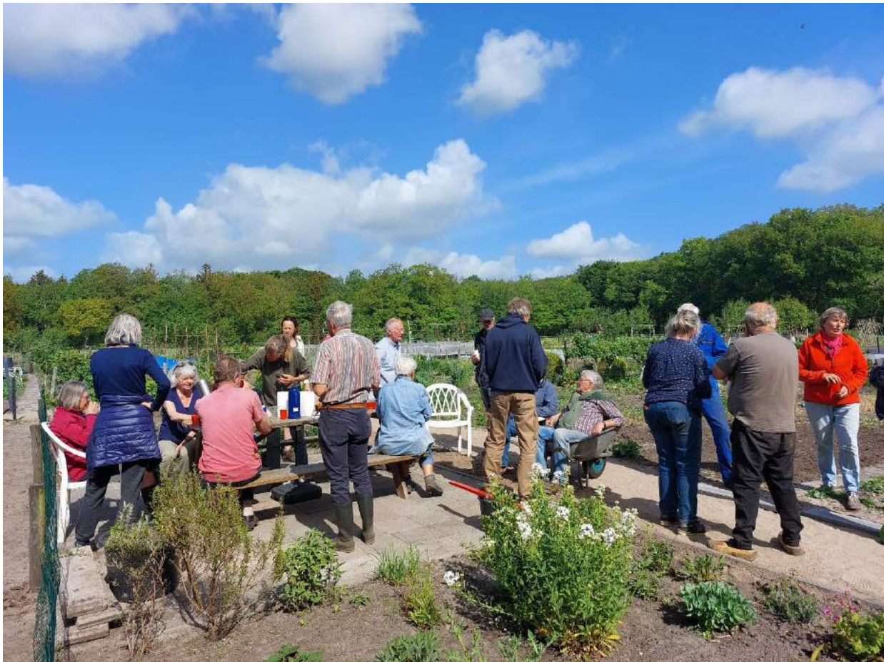
Klussendag 14 mei 2022 – tijd voor koffie/thee en eigen gemaakt gebak